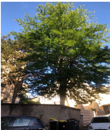
Le févier d'Amérique du 21 rue Royet ( chantier Lyon Metropole Habitat )

Côté chantiers immobiliers : c'est l'été et les arbres du Clos Bissardon sont magnifiques : Comment imaginer qu'ils seront abattus pour les besoins des projets immobiliers en cours ?