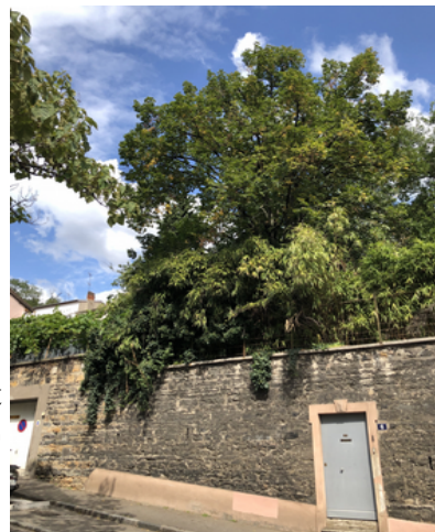
Les arbres et la treille du 6 et 8 rue Royet ( chantier Cogedim)